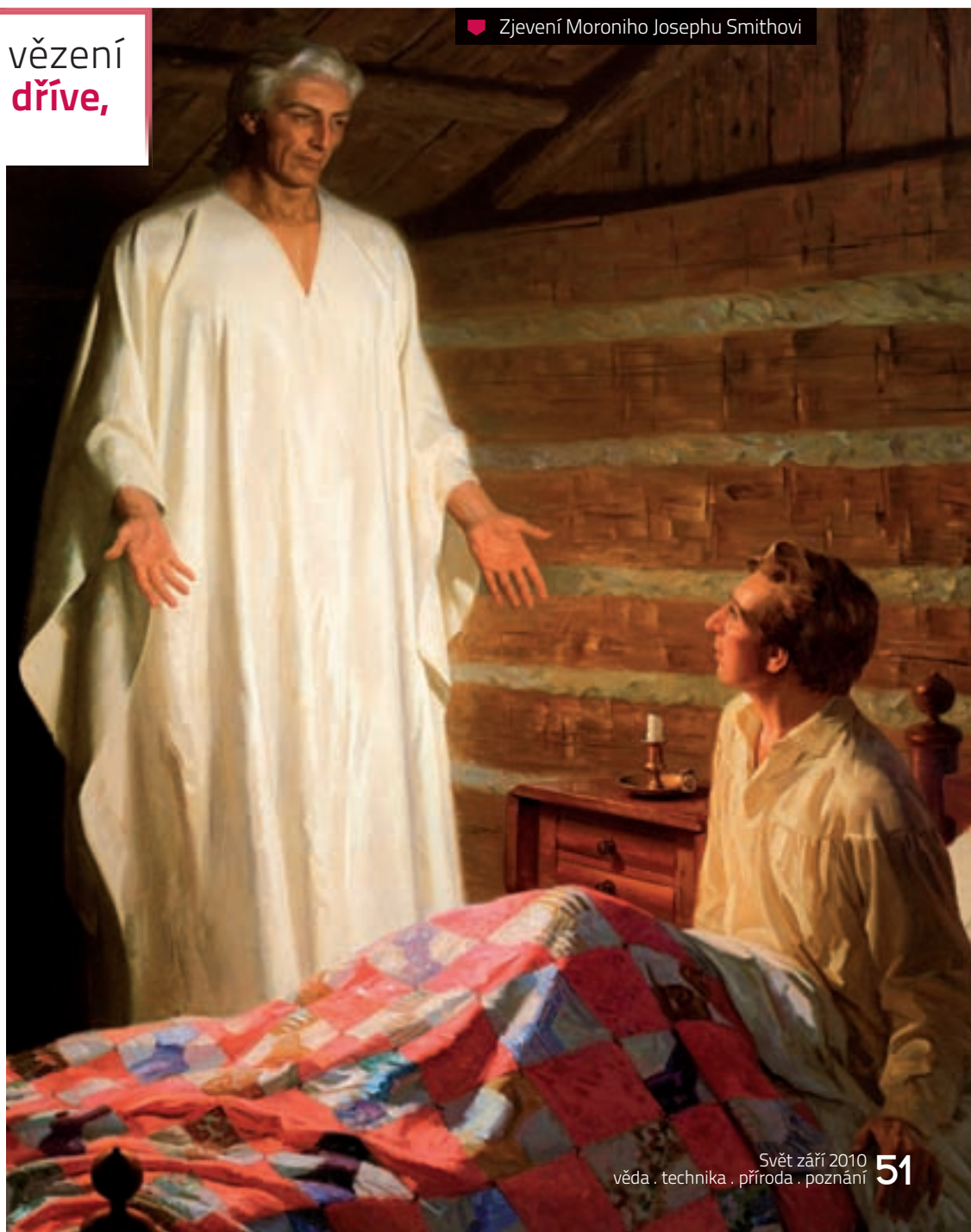
♥ Zjevení Moroniho Josephu Smithovi

Pokud k mravním zásadám, důrazu na rodinu, na střídmy způsob života a na společenskou angažovanost připočteme ještě poněkud přímocharý, fundamentalistický pohled na svět, vychází nám, že mormoni jsou zvláště ve své americké vlasti sociálně velmi podobní evangelikálům, tedy probuzeným (nebo také znovuzrozeným) protestantským křesťanům, kteří tvoří v USA značnou část obyvatelstva (v některých státech dokonce jeho většinu). Tato podobnost je ovšem výsledkem velké proměny mormonského spole-