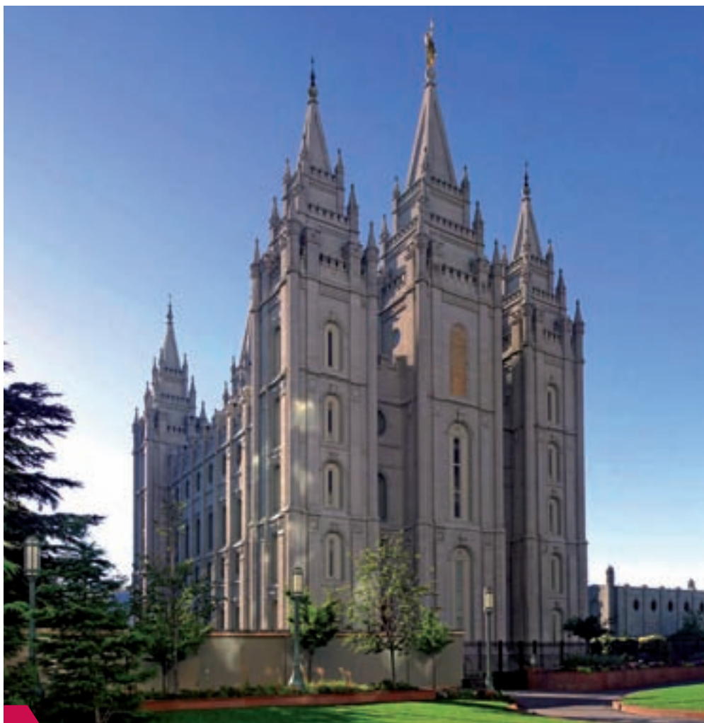
Ústřední chrám Církve Ježíše Krista Svatých posledních dnů v americkém městě Salt Lake City byl vystavěn v letech 1853–1893

Jak je patrné z předchozích vět, velkou roli pro dosažení vyšších „stupňů slávy“ hrají chrámové obřady. Mormonské chrámy jsou nepřístupné nemormonské veřejnosti a i mormoni musejí splnit řadu podmínek, než od církevního nadřízeného získají doporučení k tomu, aby mohli vejít do chrámu. Jedním z chrámových obřadů je sňatek na věčnost. Je nutný pro vstup do nejvyššího, celestiálního království, a tedy pro věčné přebývání celé rodiny v přítomnosti Boha