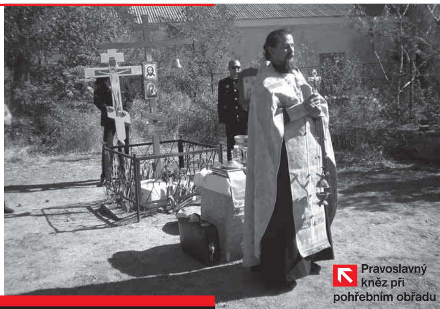
↘ Pravoslavný kněz při pohřebním obřadu

Ve středu pravoslavného (ortodoxního) křesťanství je „pravá oslava“, tedy správná bohoslužba. Každou neděli a o svátcích je slavena Božská liturgie (obdoba západní mše svaté). Je delší než mše v římskokatolické církvi a není příliš časté, aby se jí slovy nebo zpěvem účastnili všichni